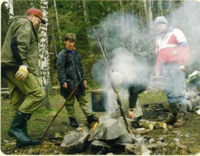
Göra upp och använda eld