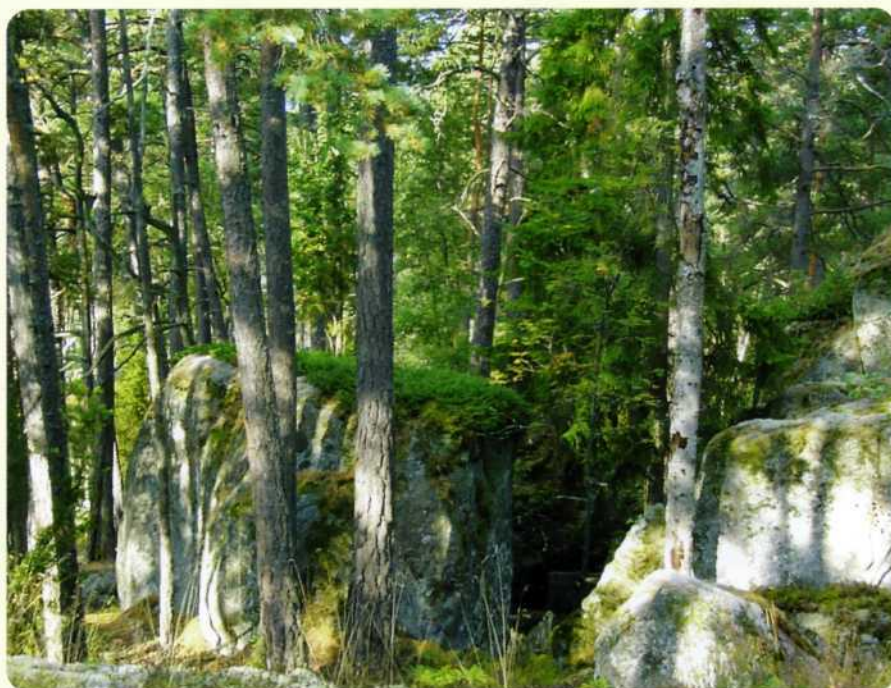
Tivedens skogar erbjuder stor variationsrikedom för överlevnadsutbildningen.

Utbildningen leds av erfarna och auktoriserade instruktörer och säkerhet är en av grundstenarna i vår verksamhet. Sveriges Överlevnadscentrum kan i vissa fall erbjuda utbildning även på andra platser i Sverige och Norden.