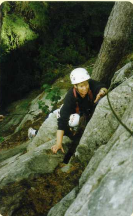
Klättring och nedfirning