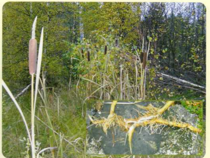
Växtlära, ätliga växter.